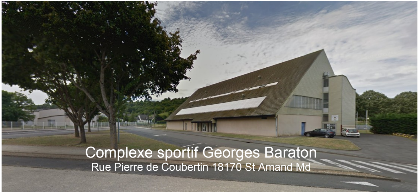
Complexe sportif Georges Baraton Rue Pierre de Coubertin 18170 St Amand Md